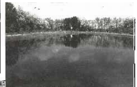
9 maggio '99: l'immissione di carpe nel laghetto

Zona ad alta fruizione riservata ai bambini, dotata di attrezzature a loro dedicate: collinetta, gazebo ed attrezzature in materiali naturali per giocare. Bosco e macchie con specie decorative, da fiori, da bacca, con coloritura autunnale. Come per tutte le aree pubbliche appositamente attrezzate per il gioco dei bambini, è vietata la circolazione dei cani (art. 22 del "Re-