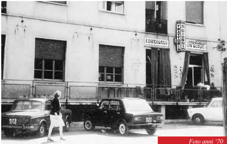
Foto anni '70