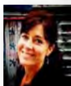
Tiziana Cona Contemporaneo