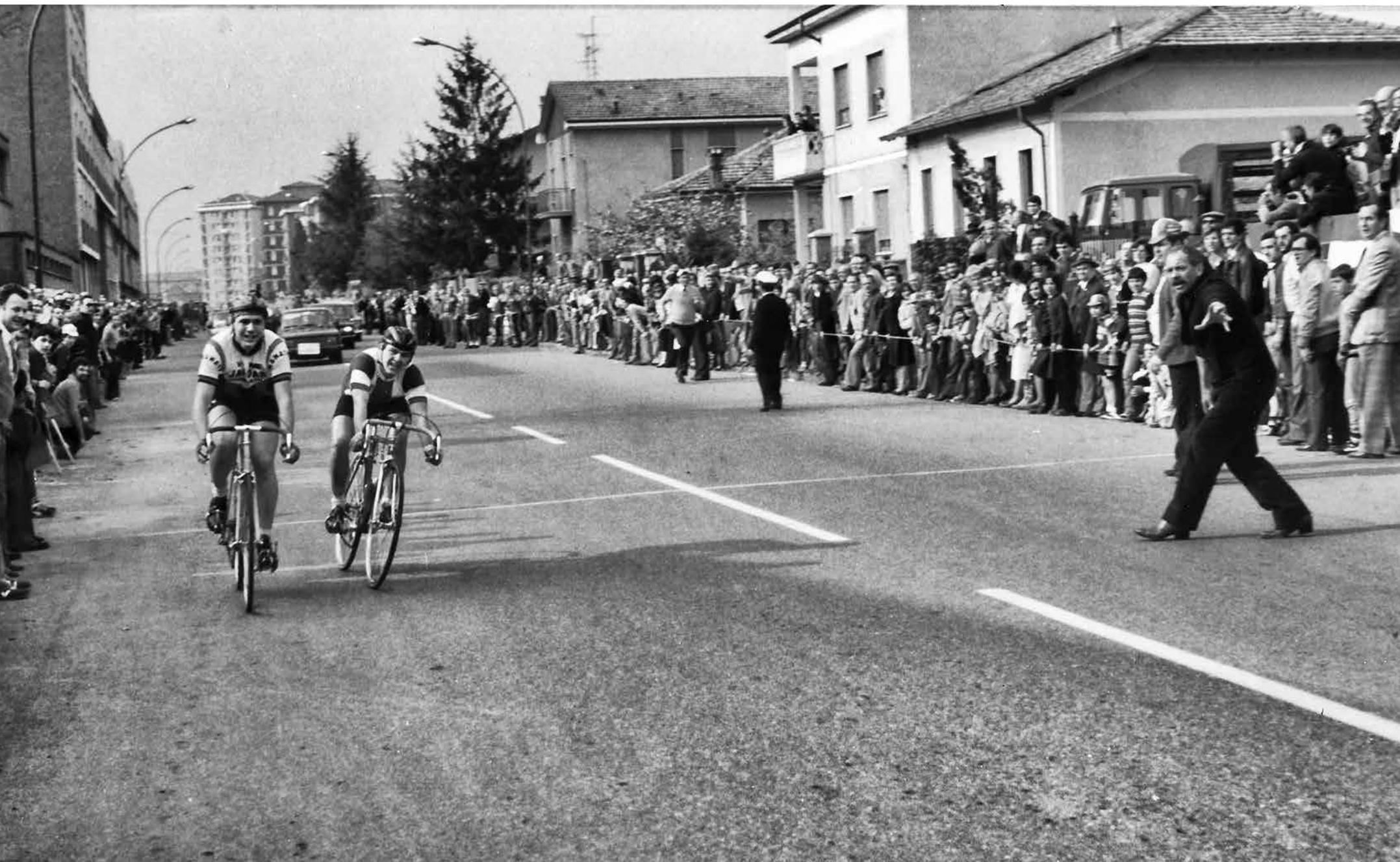
Arrivo corsa ciclistica, via Libertà - anni 70

settimo milanese IL COMUNE Periodico di informazione a cura dell'Amministrazione Comunale